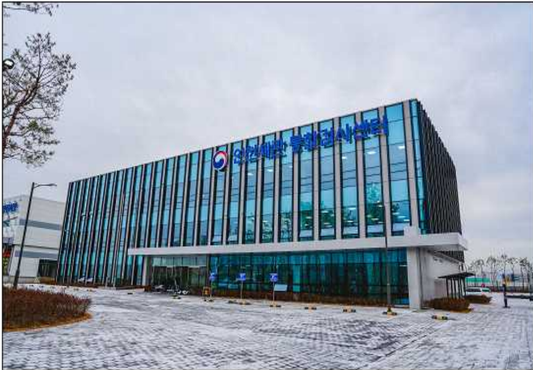
< 통합검사센터 사무동 >