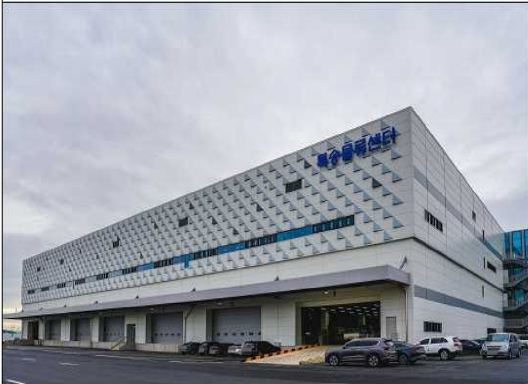
< 해상특송물류센터 >